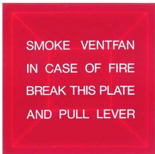
割板の英文タイプ