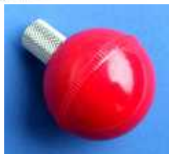
握玉 2-13-15015 サイズ 35mm球形